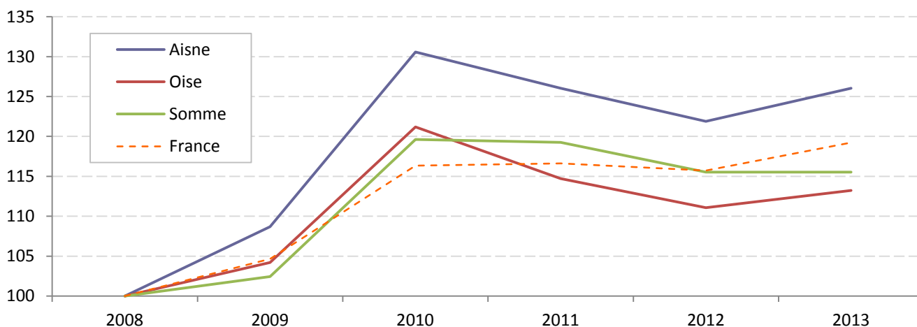
Graphique 2 : Evolution de l’emploi associatif sportif dans les départements picards